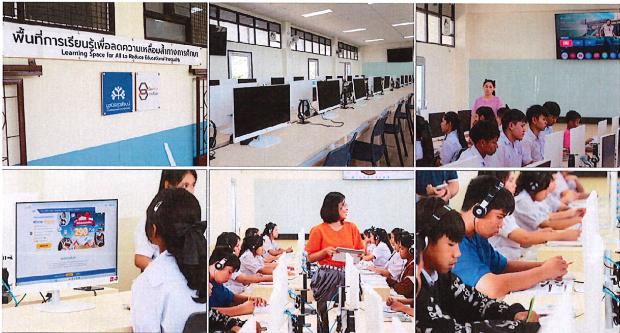
ภาพพื้นที่การเรียนรู้ยุคดิจิทัลไร้ขีดจำกัด

นอกจากนี้ โครงการร้อยพลังการศึกษา มูลนิธิยูวทัศน์ ยังร่วมสนับสนุนในมิติการพัฒนาคุณภาพสภาพแวดล้อมการเรียนรู้ ซึ่งอยู่นอกเหนือกรอบการส่งเสริมของ BOI เพื่อปรับปรุงสภาพแวดล้อม และเสริมอุปกรณ์ในห้องเรียน เพื่อให้เด็กนักเรียนมีพื้นที่การเรียนรู้ที่เหมาะสมและมีประสิทธิภาพ และเสริมสร้างทักษะด้านเทคโนโลยีที่จำเป็นต่อการเรียนรู้ในอนาคต