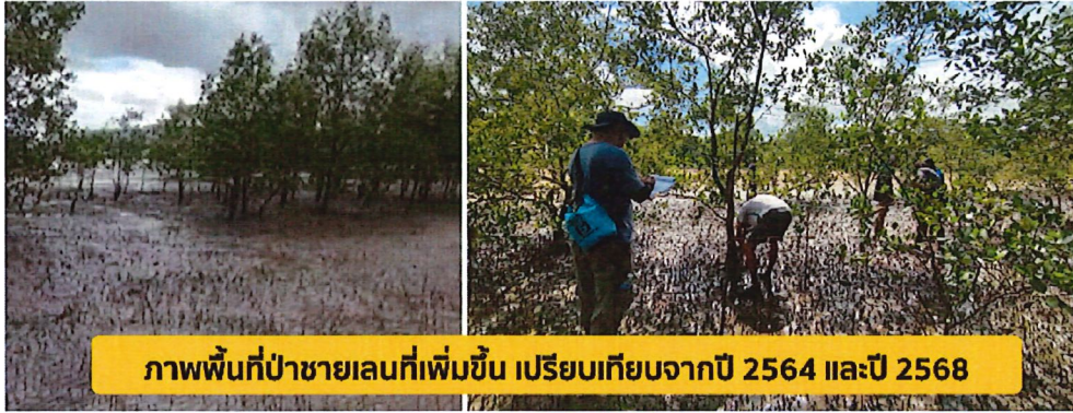
ภาพพื้นที่ป่าชายเลนที่เพิ่มขึ้น เปรียบเทียบจากปี 2564 และปี 2568